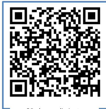
QR al procedimiento

https://www.mscbs.gob.es/profesionales/saludPublica/ccayes/alertasActual/nCov-China/