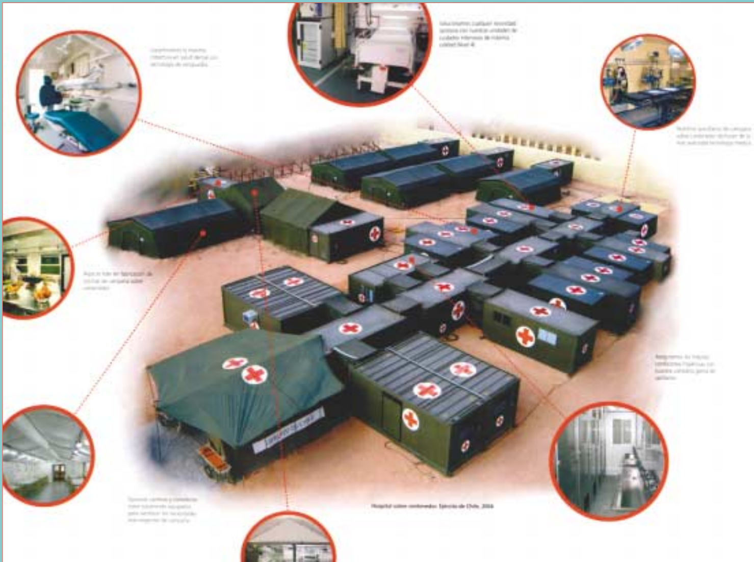
Despliegue de un hospital de campaña montado sobre contenedores.