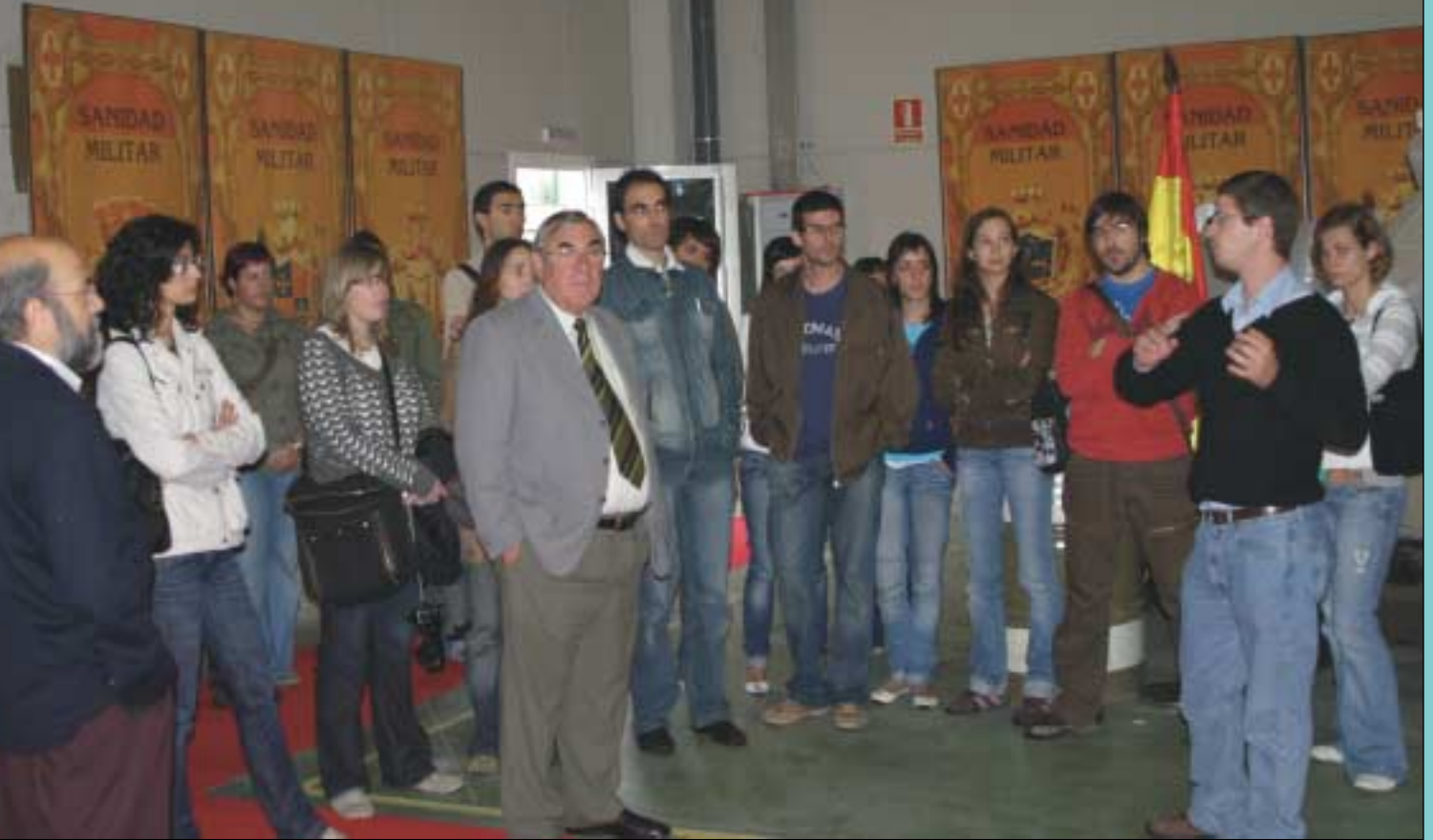
Iniciando la visita.