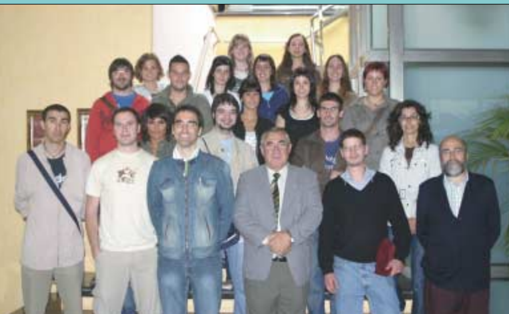
Los alumnos y profesores del Curso de Urgencias con el presidente y vocal del Colegio.