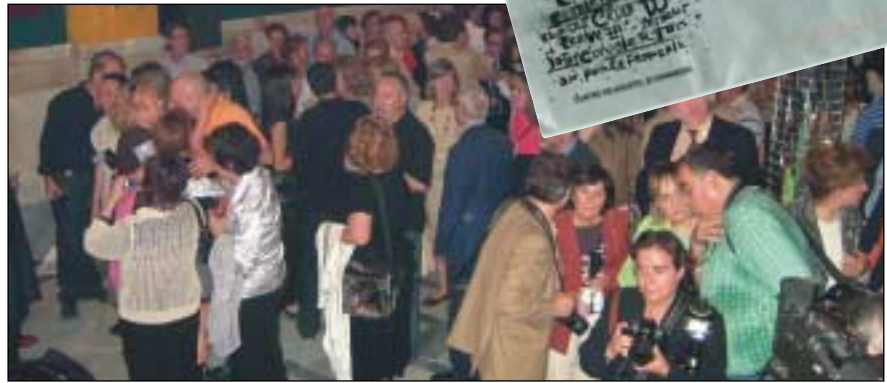
Aspecto del día de la inauguración oficial.